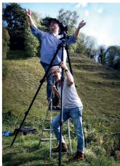
Auch diesmal wieder mit von der Partie: Agenturchef Martin Reiss, der mit seinem Team das Shooting organisierte und Fotograf Axel Killian. Die beiden durften die Baßgeigenfamilie das Jahr über fotografisch begleiten und hatten dabei neben jeder Menge Arbeit auch sichtlich ihren Spaß.

Da man die Menschen ja bekanntlich an ihren Früchten erkennen kann, dürfte der visuelle Einblick in Arbeitsalltag und